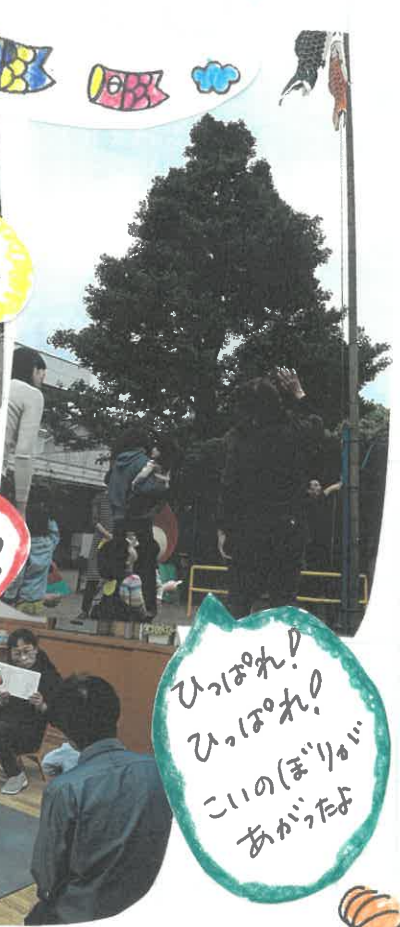
ひっぱれ! ひっぱれ! こいのぼりも あがったよ