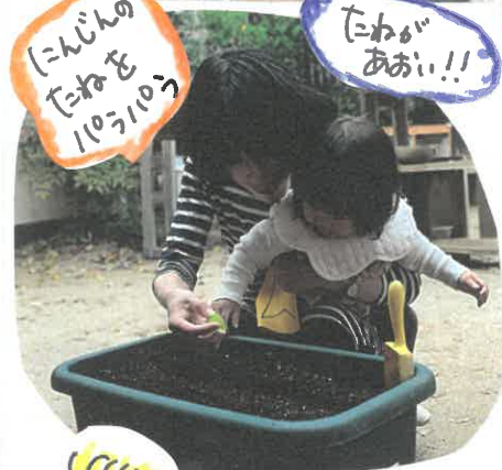
にんじんの たねを 100%100%