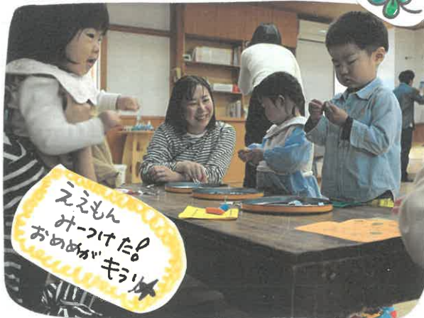
ええもん みつけた おはよう キラキラ

いるような「遊び」だけでなく例えは日常生活の中で手を洗うといった行為でも子どもにとっては、水の感触、せけんのあわあわ、流れていく水を見たり、水道の蛇口から出る水の強さ弱さの違いをくらべたり...どれもこれも「遊び」につながっているのです。自分の考え判断で